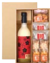
7088 アソートBOX (瓶+食品詰合せ用) ※詰め合わせイメージであり、実際の商品ではございません。 ガイド Vol.9 P18掲載