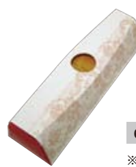
6900 小瓶200ml1本入ギフトケース