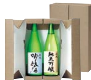
7119 布地 中瓶2本入 オープンケース ガイド Vol.9 P22掲載