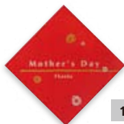
1415 母の日シール ガイド Vol.9 P55掲載