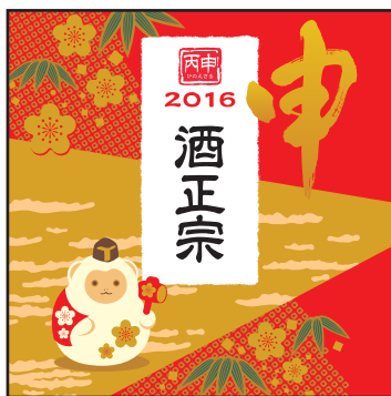
7799 干支ラベル サイズ:150×150mm 販売ロット:1,000枚

2016年の干支は「申(さる)」です。おめでたいだるまのような形の申をモチーフに、今年も干支ラベルを制作しました。「酒正宗」のタイトル部分は貴社の銘柄が入ります。