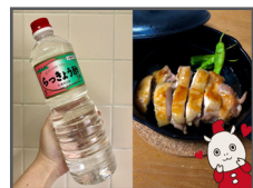
▲うずまき酢株式会社様のお酢を使った「鶏の甘酢照り焼き」

普段は石川県の食べ物やイベントなどを紹介している、弊社オリジナルキャラクター「いしかばくん」も、新たな切り口で発信しています。外出自粛が要請され、ネット通販などによる「巣ごもり消費」の需要が高まっていることから、お取り寄せできる調味料を使ったレシピを紹介したり、「おうち時間」に親子で楽しめるアイテムを制作したりして、ブログ記事に公開しています。