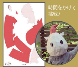
時間をかけて挑戦!